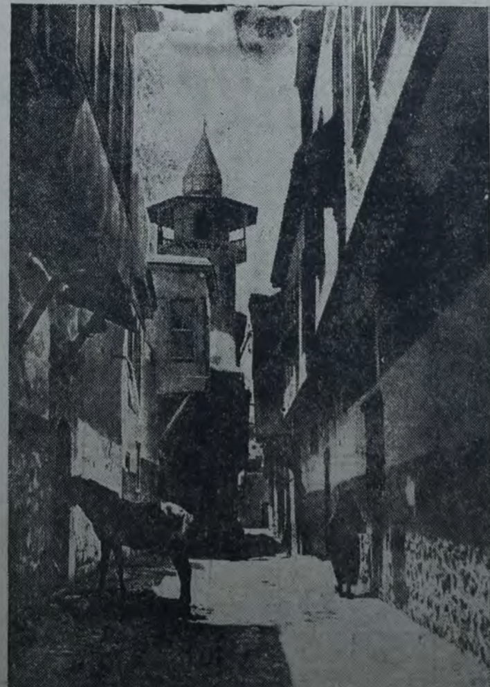
UNA CALLE TIPICA DE DAMASCO EN PALESTINA. AL FONDO APARECE LA mezquita de Selim el Grande. En la conferencia dada ayer por Vandervelde se refirió a la obra que realizan actualmente los judíos para hacer de Palestina el asiento moral de la raza

Se vota una moción de limitar el uso de la palabra a cinco minutos y se aprueba.