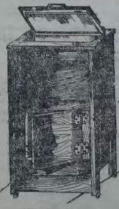
Heladera De pino Brasil, lustrada imitación roble, con herrajes niquelados; forrada interiormente con cinc. Medida: 86 cm. de alto por 45 de frente y 35 de fondo. 23 00