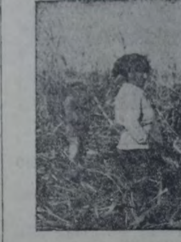
LA VORACIDAD CAPITALISTA EXIGE LA TAREA DE TODOS: HOMBRES, MUJERES Y NIÑOS. ESTO sucede en el gran país donde no hay clases sociales...