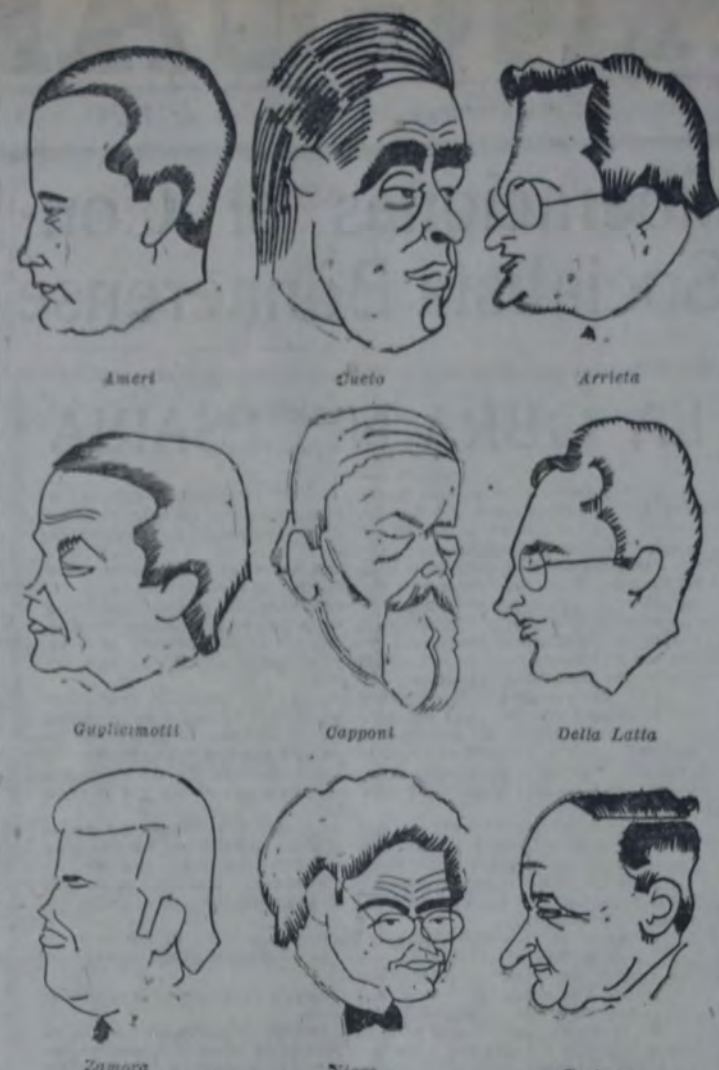
FIGURAS DEL CONGRESO DE LA FEDERACION SOCIALISTA VISTAS POR BEN SAID, PARA "LA VANGUARDIA"