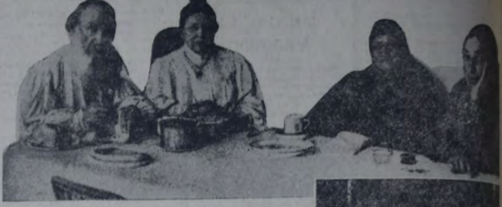
UN ALMUERZO DE TOLSTOI EN YASNAIA POLIANA, SENTADO A SU LADO VENSE SU ESPOSA SOFIA, SU HERMANA MARIA, MONJA DEL CONVENTO DE CHARUVACINO, Y SU HIJA