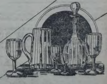
Juego de copas De cristal americano. Compuesto de: 12 copas agua, 12 vino, 12 Oporto, 12 licor, 1 botellón y 1 jarra; las 50 piezas. 9 80