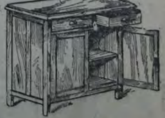
Mesa - alacena De pino Brasil, especial para despensas ó cocinas; con 2 cajones. Medida: 100 x 60 centímetros. 17 50