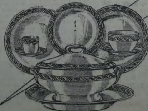
Juego de mesa De loza reforzada, con vistosa guarda color azul. Compuesto de 83 piezas. 28 50