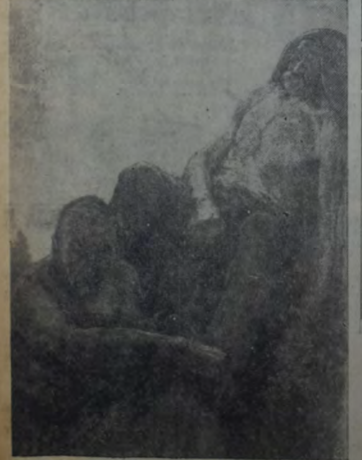
FRAGMENTO DE UN TRIPTICO, POR FACIO HEBEQUER

muestra consecutiva con aquella pintura francesa finisecular en lo que a la tesis se refiere. Y la expresión en gestos episódicos. Sólo que no abandona al significado de su pensamiento, el mérito estético de la obra. Para ello utilizaría otros vehículos. Los del escritor, entonces. Tal como lo viene haciendo cuando se lo propone. Ese pensamiento de Facio Hébequer