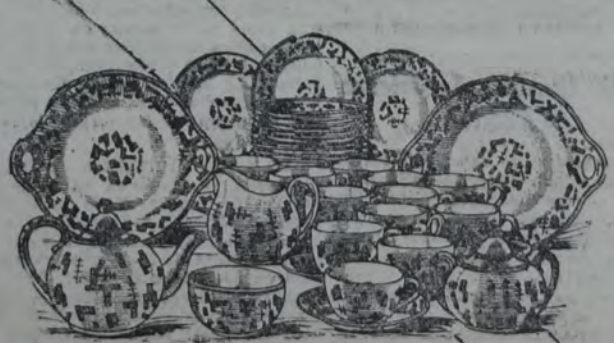
Juego para lunch De loza de buena calidad, con vistosos dibujos. Compuesto de 30 piezas. 12 50

LA GRAN EXPOSICIÓN DE BAZAR, MENAJE y ARTÍCULOS SANITARIOS, LA CUAL COMPRENDE TODOS LOS ARTÍCULOS DE NECESIDAD PRÁCTICA PARA EL HOGAR. LOS PRECIOS HAN SIDO FIJADOS MUY BAJOS, PARA HACER QUE ÉSTA GRAN EXPOSICIÓN RESULTE ATRAYENTE POR TODOS CONCEPTOS. Una visita a nuestra Casa Central (4.º piso), ha de ser para todos interesante y provechosa.