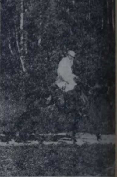
EL CONDE LEON TOLSTOI efectuando un paseo a caballo en el bosque de Yasnaia Poliana