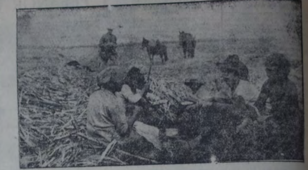
LA HORA DEL ALMUERZO, DEL FRUGAL ALMUERZO QUE NO DEVUELVE LAS ENERGIAS PERDIDAS en el intenso trajín.