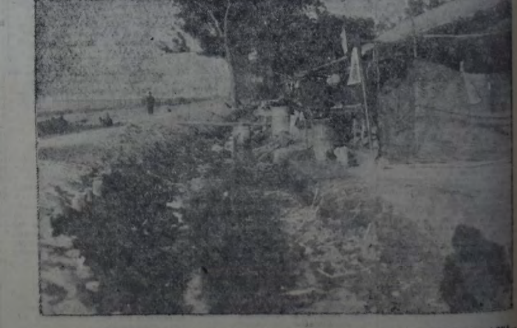
LAS "VIVIENDAS" DE LOS OBREROS DEL INGENIO. TECHOS DE CING Y PAREDES DE LONA.

Las proveedurías son lugares donde la higiene brilla por su ausencia y donde la explotación del obrero surge con mayor claridad. Mercaderías de la peor calidad y precios sumamente elevados