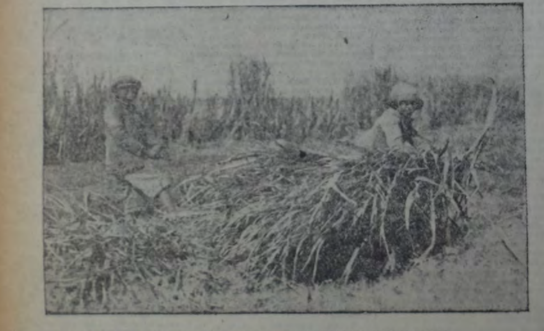
ESTOS MUCHACHOS GANAN $ 0.20 POR DIA, TRABAJANDO 14 HORAS.