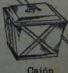
Cajón De hierro galvanizado reforzado, para residuos, N.º 7, a $ 5.50; N.º 5, 4.50; N.º 4, 3.90; N.º 3, 2.90; N.º 2, 2.50; N.º 1, 1 60